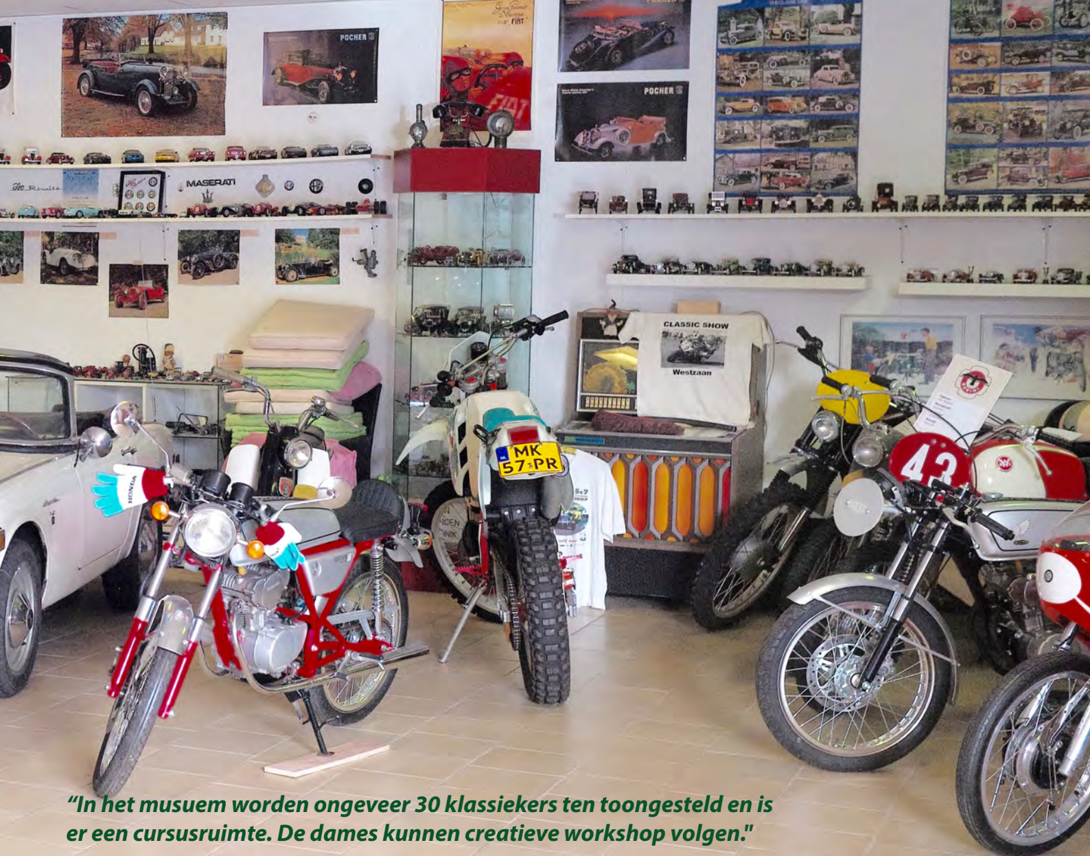
“In het museum worden ongeveer 30 klassiekers ten toongesteld en is er een cursusruimte. De dames kunnen creatieve workshop volgen.”

we het natuurgebied Wormer- en Jisperveld binnen. Dit gebied ligt ingesloten tussen Wormer, Oostknollendam, de ringvaart naar Spijkerboor en het Noordhollandschkanaal, Neck, de Rijk en Purmerend.